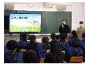
貴重な助産師の仕事の話

大阪母子医療センターの助産師さんをゲストティーチャーにお招きして3年生に向けて性教育を実施しました。助産師の仕事の内容や実際の現場の話、新しい生命に対する責任や避妊、性感染症やその予防策など多岐にわたってお話が聞けました。専門家からの話に生徒たちは食い入るように聞いていたのが印象的でした。また、妊娠、出産までの映像を見た後、持ってきてくださった赤ちゃん人形を3年生のみんで抱かせていただきました。先ほどの顔と打って変わって優しい柔らかな表情で赤ちゃん人形を抱いている姿が印象的でした。感想にも命の大切さや家族への感謝などがたくさん綴られていました。