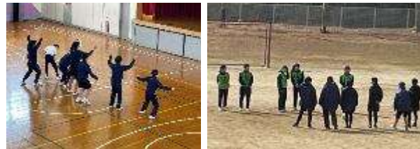
みんなの成長を感じます

雪がちらつく冷たい空気の中、女子は歓声をあげながらサッカーをしています。普段の様子からはうかがえない積極的にボールを取りに行く姿勢が見ることが出来ます。男子はダンスに取り組んでいます。特に上級生は昨年からの発展があり創意工夫が感じられます。