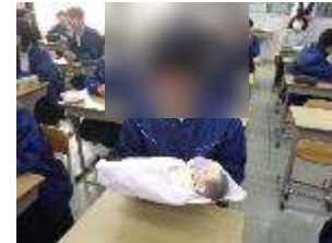
みんな優しい笑顔に