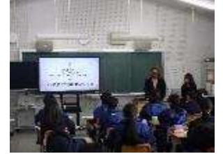
貴重な仕事や人生の話