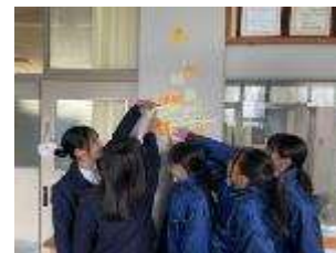
私の身長はどこかな

休み時間、生徒たちが保健室を訪ねてやることの一つに「身長を測ってみる」というのがあります。本校の保健室前にはメジャーとともに芸能人やアニメのキャラの身長を示しています。生徒が集まり、自分の身長と比べて楽しんでいます。