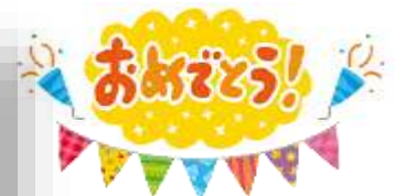
「カレンダー賞・秋」