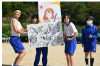
『クラブ紹介リレー』