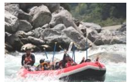
吉野川ラフティング

修学旅行の目標「『共に尊重し愛、何事にも全力な学年』」142ページのアルバム ~それぞれの未来へ LET'S GOGO!~ が、さまざまな感動体験を通して達成できていたと思います。