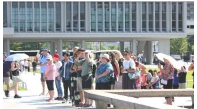
東中学校3年生の合唱に聞き入る人々

初日の夜は、国民宿舎みやじま「杜の宿」に宿泊。夕食、入浴の後のクラスミーティングでは、自分の想いを語る仲間の姿から、新たな発見もあったようです。