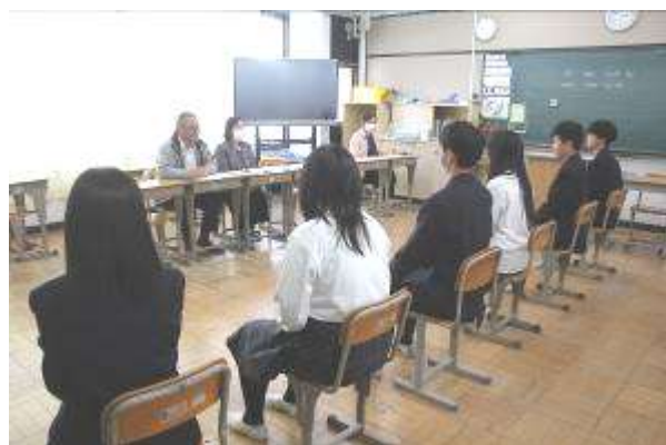
2日間に渡って 地域の方が面接官

また、12月10日(火)と11日(水)には、3年生全員が、地域の方が面接官になった「面接練習」を行いました。