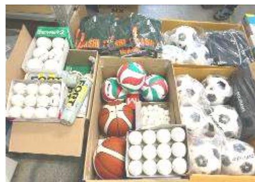
ボールなどが寄贈されました

生徒たちの主体的な運動を通じての体力づくりに“あしながさん”が共感してくださっているからだと思います。