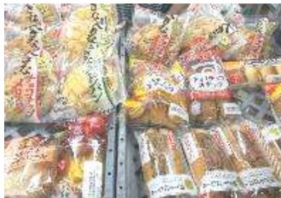
体育大会で保護者にパン販売