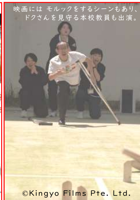
映画には モルックをするシーンもあり、 ドクちゃんを見守る本校教員も出演。