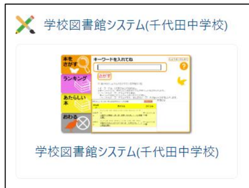
「学校図書館システム」アプリ