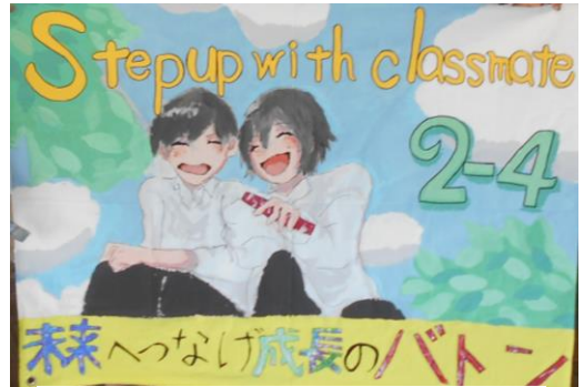
2-4 Step up classmate 未来へつなげ成長のバトン