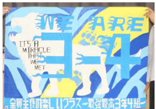
3-4 全員主役の楽しいクラス最強最高3年4組