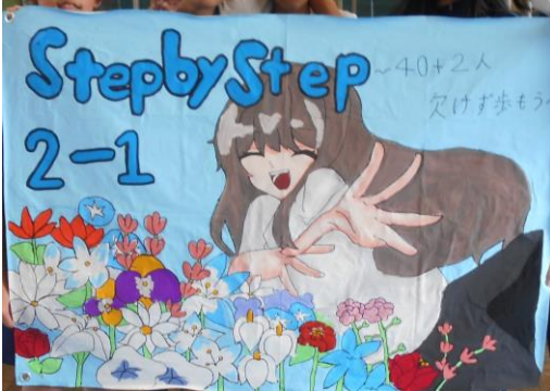
2-1 Step by Step 40+2人欠けず歩もう