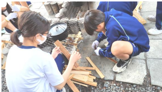
協力して薪の準備をしているところ

ともにする中で、普段は見えない友だちのよいところが見えたり、いつもは見せることのなかった性格が見えたりして、おどろいたり、ストレスがかかったりした人いることでしょう。それでも、自分本位な言い分や行動＝わがままをおさえ、相手の気持ちを考え、相手に寄り添って協力している姿に、今後のさらなる成長が楽しみになりました。