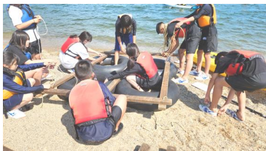
協力していかだを組み立てているところ

6月1日(土)～2日(日)、2年生宿泊学習を実施。奥琵琶湖マキノパークホテルにて、1日目は、二人乗りカッターやいかだづくり(自分たちで組んだいかだに実際に乗る)、浜遊びなどを楽しみ、夜レクではいくつかのゲームの後、フォークダンス(マィマィム)やみんなで歌を歌うなどして