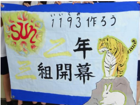
2-3 1193(いいくみ)作ろう 二年三組開幕