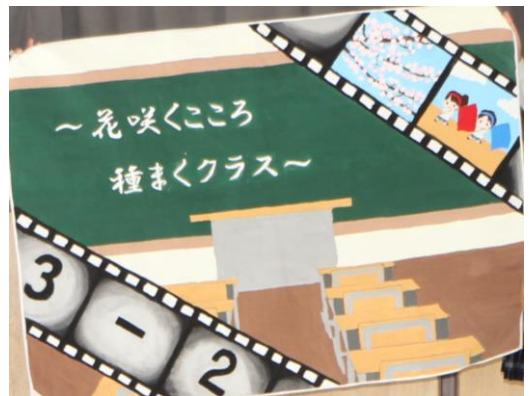
3-2 花咲くころ 種まくクラス