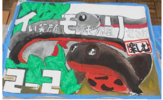
2-2 いい笑顔 モリモリ リさこと楽しむ